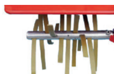
Kombinacija flaksa i širokih kožnih traka za visoku travu i korove