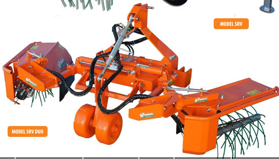
MODEL SRV DUO