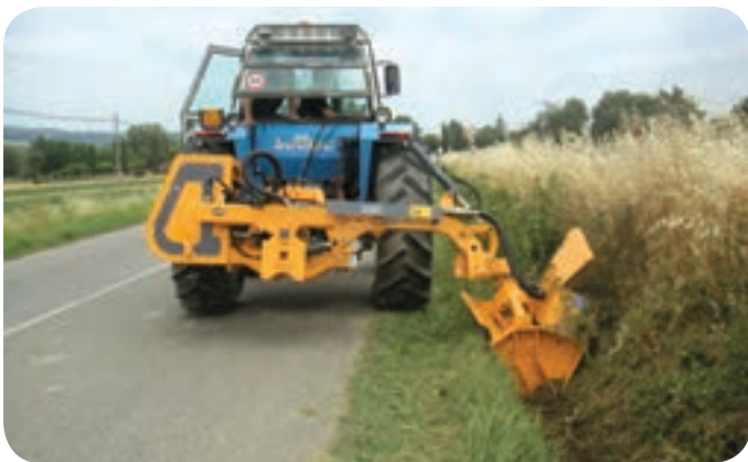
MODEL DSL+35 B-I