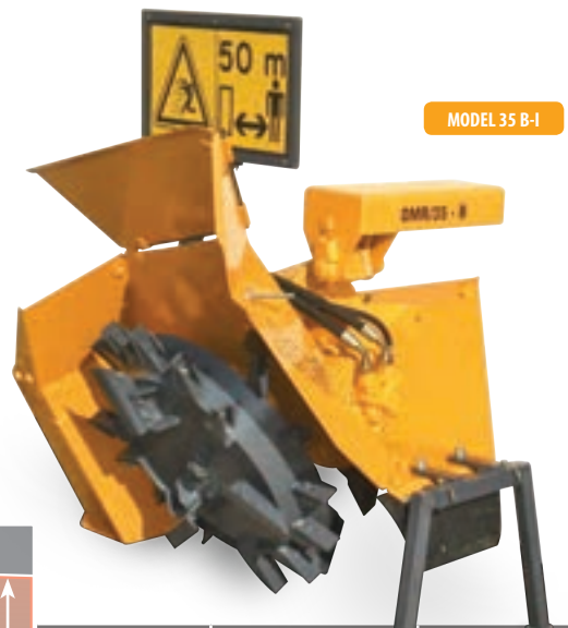
MODEL 35 B-I