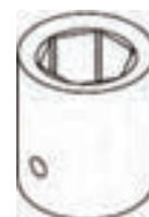
Hexagon - spojka