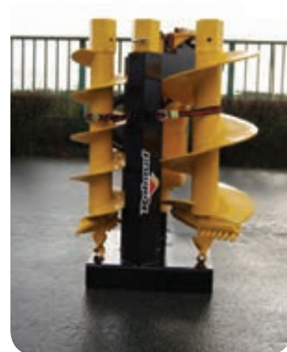
Stalak za skladištenje bušilice i svrdla