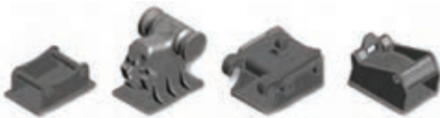
Slika 2 ( primjeri nosača/spojke za brzo kopčanje)