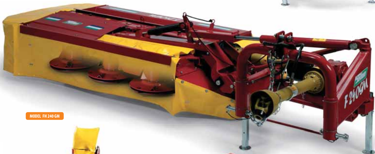
MODEL FH 240 GM