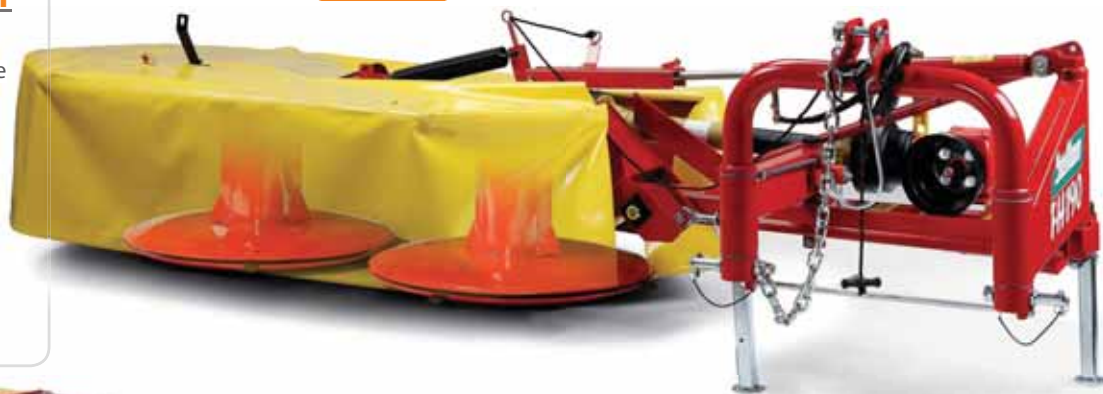
MODEL FH 190