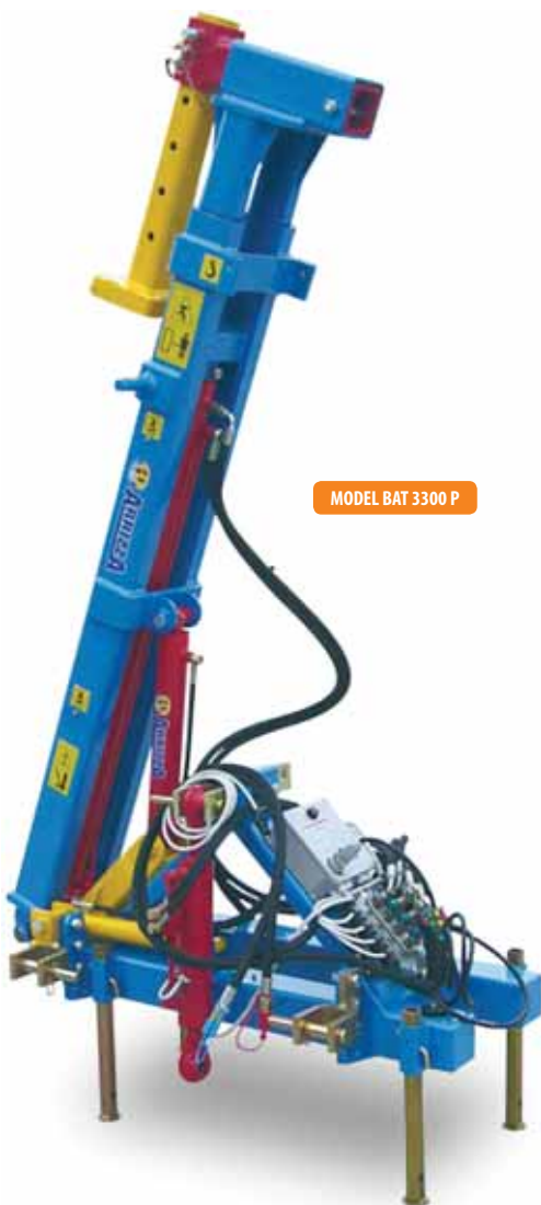
MODEL BAT 3300 P