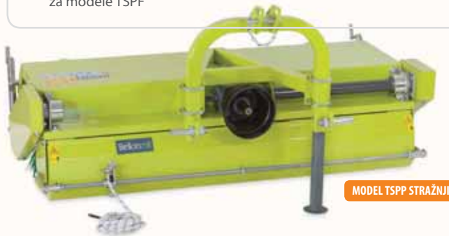
MODEL TSPP STRAŽNJI