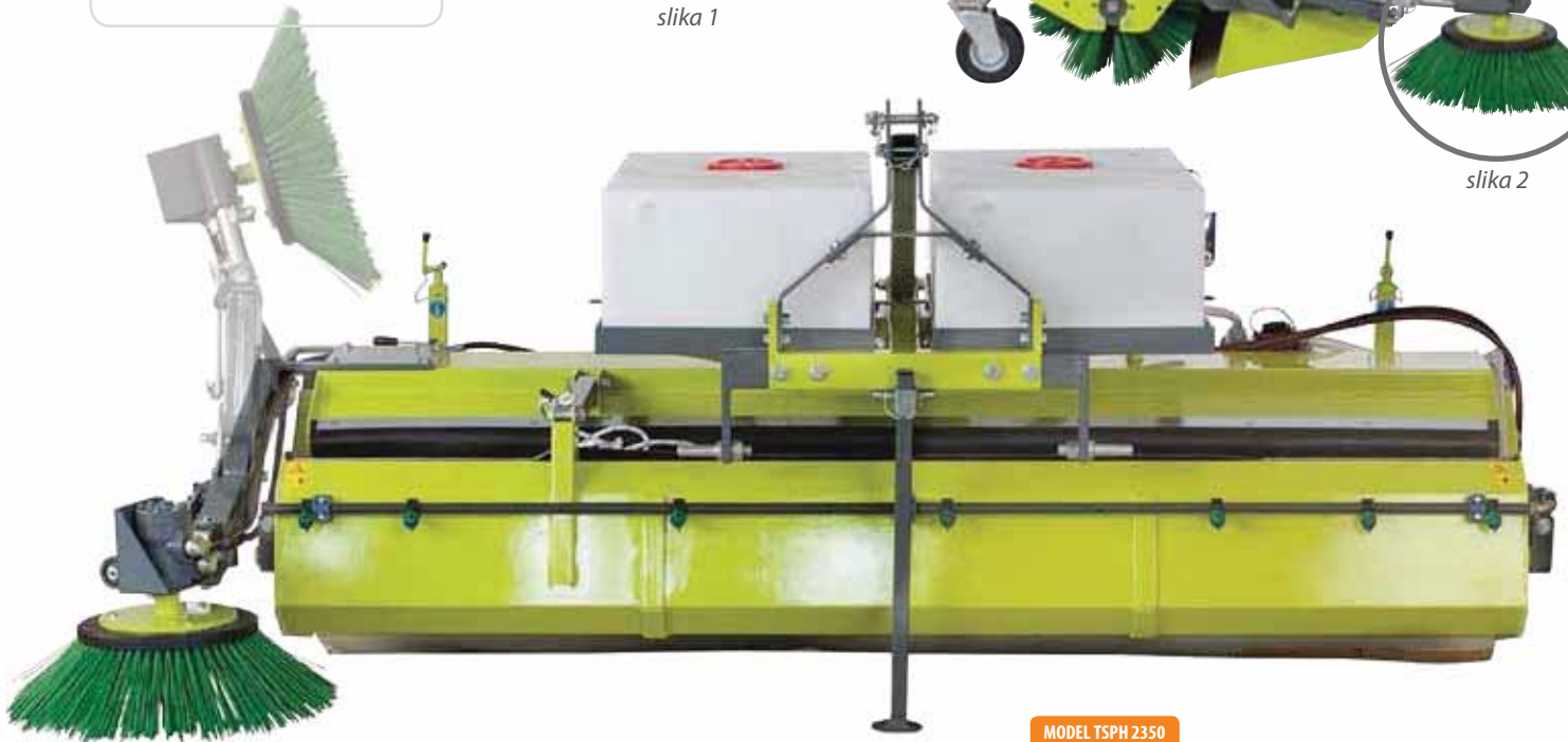
MODEL TSPH 2350