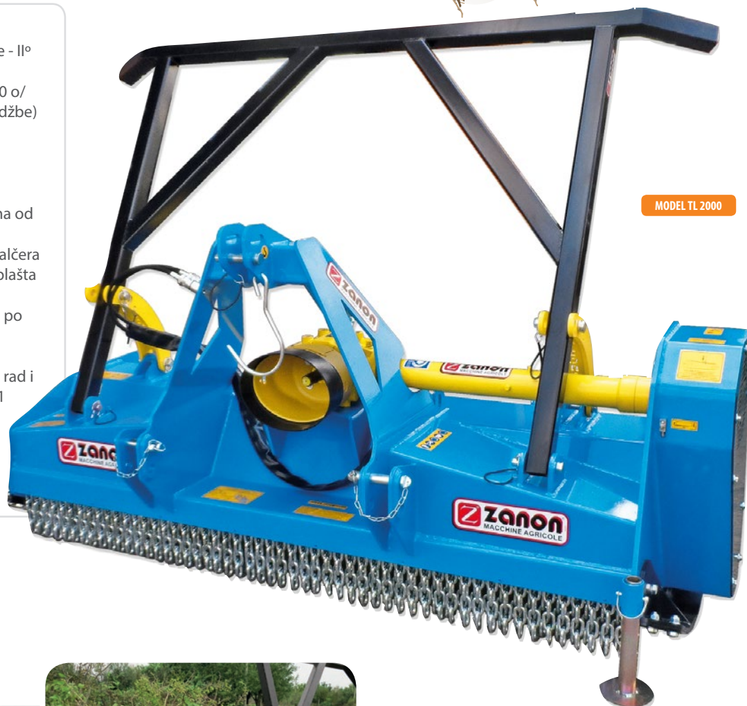
MODEL TL 2000