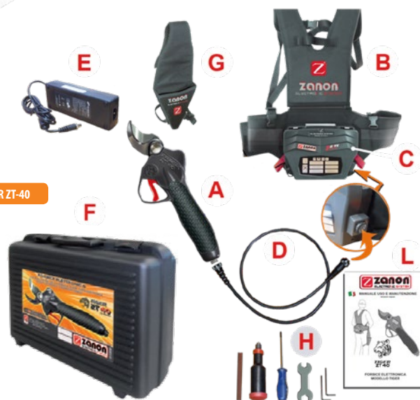
KIT TIGER ZT-40