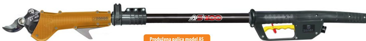
Produžena palica model AS