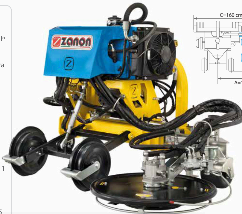
MODEL CST+IT 055