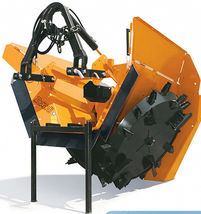
MODEL DBR. 75/32