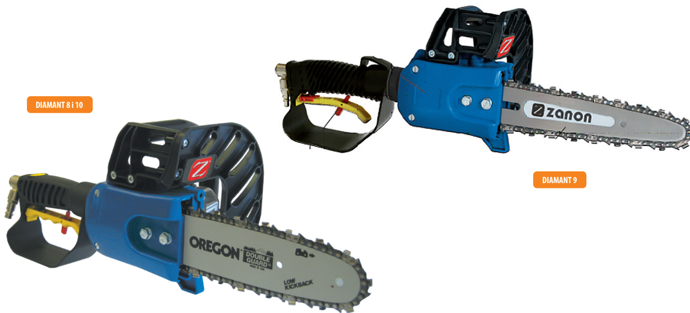
DIAMANT 8 i 10