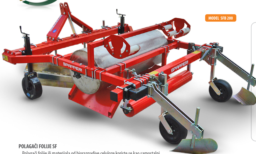
MODEL SFB 200